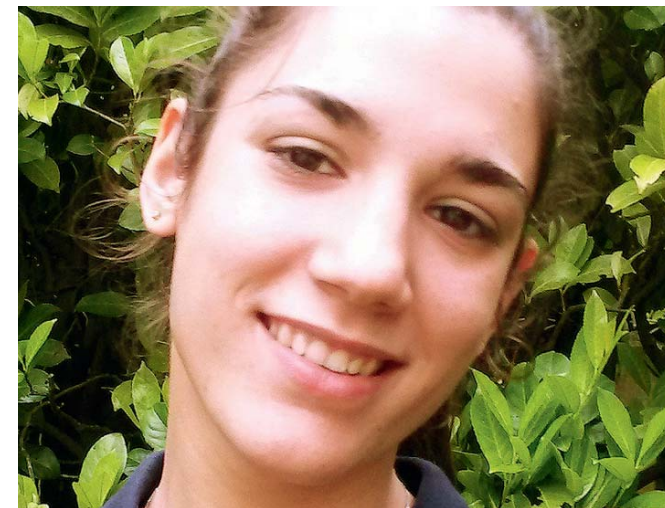
ENTREZ EN COMPETITION