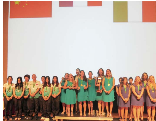
CHAMPIONNATS DU MONDE JEUNES